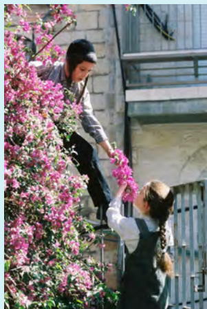
הסיפוק שבנתינה

בדקתם פעם למה כשאתם עושים טוב למישהו - אתם מרגישים הרגשה טובה כזו שאין יותר ממנה, כאשר חלב מתמלא בהרגשת סיפוק אצילית שאין דומה לה? התשובה היא שבכל אחד מאיתנו יש נשמה אלוקית שרוצה להיטיב עם העולם - בדיוק כמו